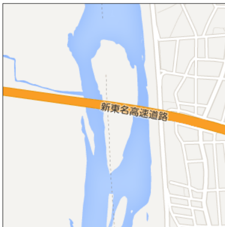
第2チェックポイント (約 19.8km 地点)